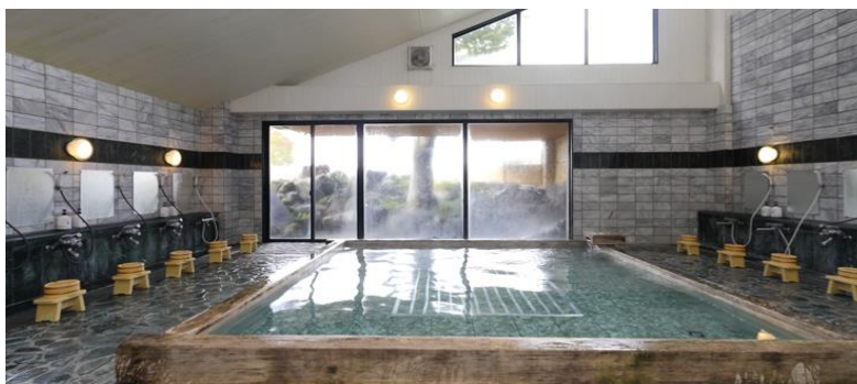
檜を使った広い湯船と露天風呂も併設