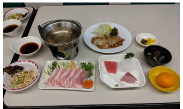
夕食の写真 ※季節により若干の変更あり