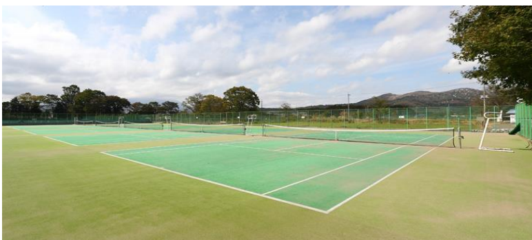
山中湖では貴重な砂入り人工芝コート