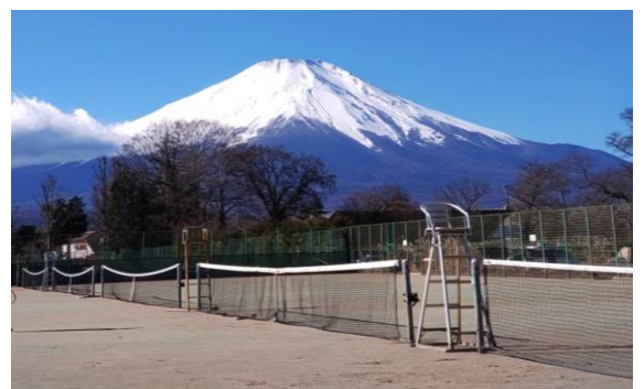
富士山が見える最高のロケーション！